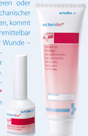
Abb.2: octenilin® Wundgel im 20 ml Faltenbalg und in der 250 ml Tube.

Octenidin-basierte Produkte haben einen besonderen Vorteil: Durch den Einsatz desselben Inhaltsstoffes ist das octenilin® Wundgel ideal mit dem Antiseptikum octenisept® bzw. der octenilin® Wundspüllösung kombinierbar. Unerwünschte Wechselwirkungen der Produkte sind ausgeschlossen. Um eine lokale Infektion zu therapieren oder verbleibende Bakterien nach mechanischer Entfernung des Biofilms zu eliminieren, kommt zuerst octenisept® zum Einsatz. Unmittelbar danach wird – ohne Abspülen der Wunde – das Hydrogel appliziert. Die sekundäre Wundaufgabe richtet sich immer nach der Beschaffenheit der Wunde. Abgesehen von PVP-Jod beschichteten Produkten kann octenilin® Wundgel mit allen herkömmlichen Verbandstoffen kombiniert werden.